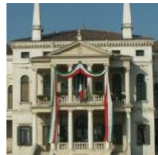
Villa Barbarigo a Noventa